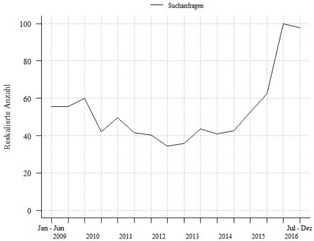
Suchanfragen für »Virtuelle Realität«